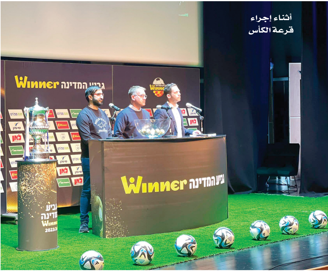
أثناء إجراء قرعة الكأس