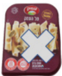
تغليف سابق - جبنة طال "هعيمك" 32%