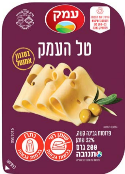
تغليف سابق - جبنة "عيمك" 15%

● سيتم إزالة الغطاء الأحمر من عبوات عيمك 200 جرام ويزال الغطاء البنفسجي من عبوات جبنة "طال هعيمك" 200 جرام و 300 جرام جبنة