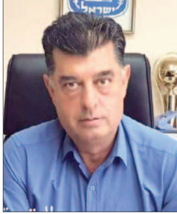
سويد سويد - البقعة