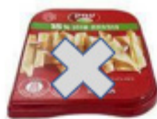
مثال: تغليف جديد - جبنة طال "هعيمك" 32%

عبوات جبنة "عيمك" 200 جرام و"طال هعيمك" 300 جرام بنسب مختلفة من الدهون والصفات المختلفة. وبحسبها فإن "تنوفا" تعمل على الحد من تأثيرها البيئي انطلاقاً من التزامها ببيئة الغد. وسيتم استبدال العبوة بشكل تدريجي، حيث ستبدأ العبوة الجديدة في الوصول إلى نقاط البيع ابتداءً من يوم الخميس.