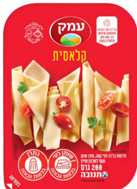
مثال: تغليف جديد - جبنة "عيمك" 15%