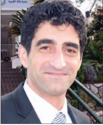
مرسي أبو مخ - باقة الغربية